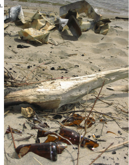
Photo prise sur la plage de Tadoussac cette semaine