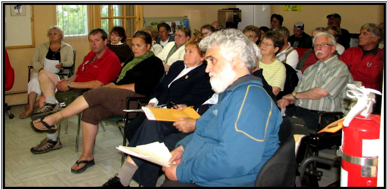
Les citoyens de Tadoussac